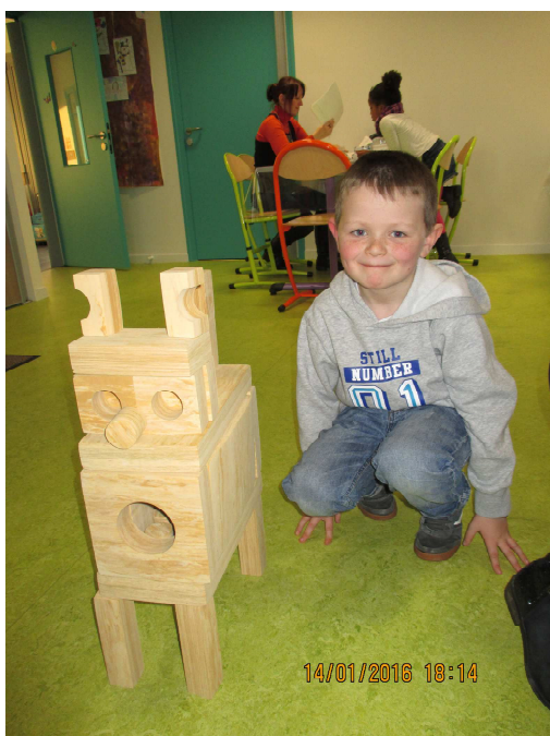
Nos bâtisseurs et leurs constructions