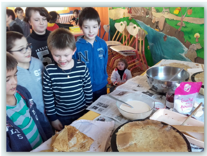
Fabrication et dégustation de crêpes le jour de la chandeleur