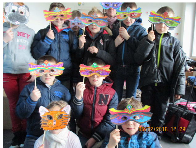
Nous sommes prêts pour aller au carnaval!