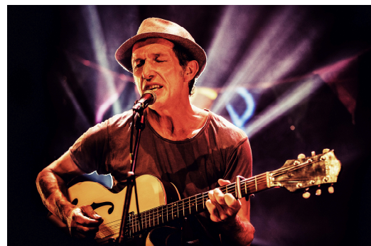
Dimanche 17 Avril 2016 à 18h30 , salle polyvalente Les Vaches Folks accueillent MIOSSEC