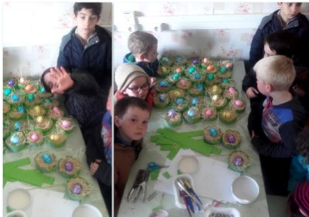
« les oeufs sont de sortie..... fabrication de petits nids pour Pâques »