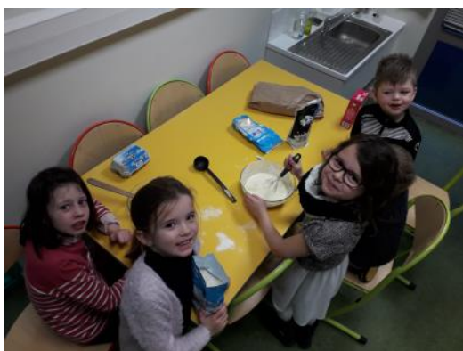
« confection pâte à crêpes pour le goûter »