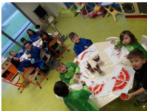
« fabrication de père Noël à la peinture »