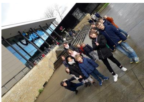
« pour terminer l'année 2018...quelle belle surprise d'aller à Quimper au cinéma pour visionner "le Grinch!" »